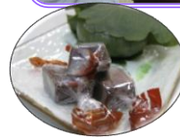
おやつの 柏餅も 大好評！